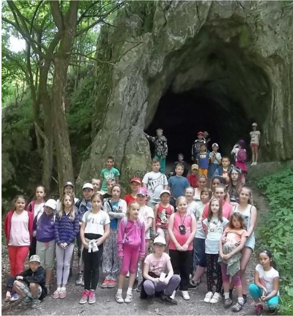
Po tradičnej fotografii pred jaskyňou sme sa pozreli ako vyzerá vo vnútri a druhou stranou (cez jaskyňu sa dá prejsť) sme sa vrátili k nášmu autobusu.